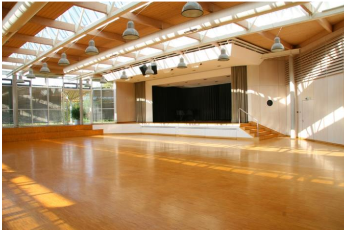
Saal mit Blick auf die Bühne