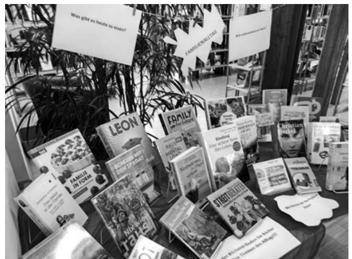
Ausstellung Familienalltag OG Bücherei

Kommen Sie vorbei und lassen Sie sich inspirieren!