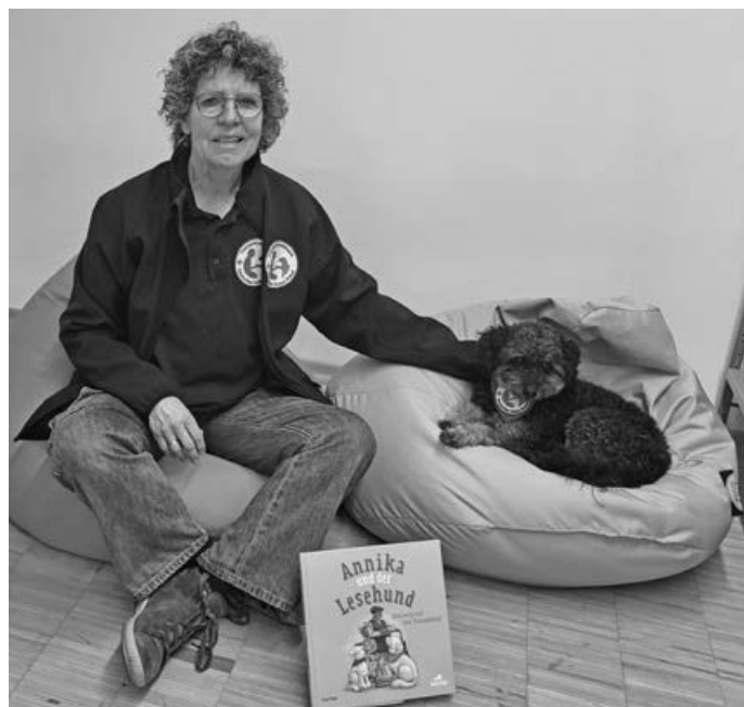
Im 1. OG der Bücherei Aichwald kann Therapiehund Freddy vorgelesen werden

Einzeltermine zu je 15 Minuten gibt es von 11.00 – 12.30 Uhr am Samstag, 18. April. Bitte unter Tel. 07 11 / 3 05 19 33 oder buecherei@aichwald.de anmelden. Eine Veranstaltungsreihe in Kooperation mit dem Therapiehundeteam des Deutschen Roten Kreuz.