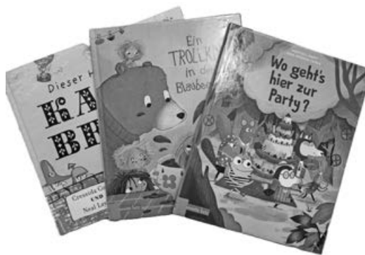
Neue Bilderbücher in der Bücherei

Am Ende der Osterferien steht der nächste Vorlesetreff-Termin an: Mechthild Laddey liest am Samstag, 11. April um 11.00 Uhr Kindern ab 4 Jahren im OG der Bücherei aus neuen Bilderbüchern vor. Auch dafür gibt es einen Stempel in der Vorlese-Pass und für 5 Stempel eine kleine Überraschung!