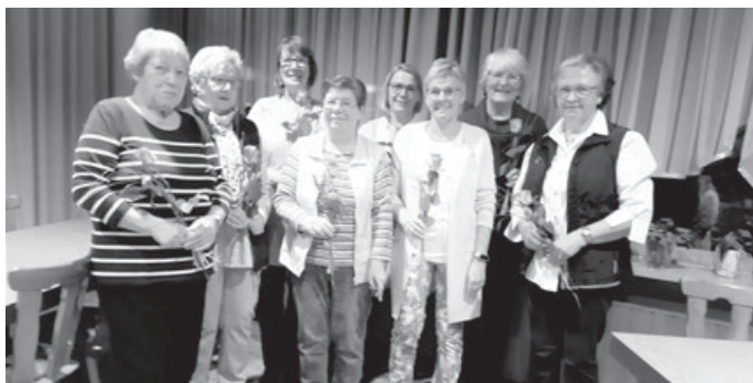
Vorstand