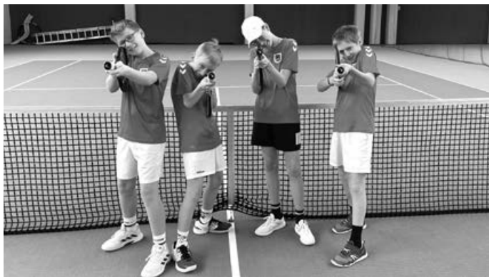
Bildunterschrift: (Fast) jeder Schlag ein Treffer!

etwas besseres Ergebnis als das erste Doppel liefern...6:0 und 6:2! Dem Ergebnis nach ein klare Sache für den TVA, der erneut gezeigt hat, dass man mit denen rechnen muss. An der Stelle auch ein dickes Lob an die Gegner, die sehr gut gespielt haben und sich als sehr sportlich fairer Gegner gezeigt haben. Auch wenn es für uns besser ausging...vielen Dank, das hat Spaß gemacht mit Euch. Und natürlich darf ein Dankeschön an unsere Jungs nicht fehlen. Klasse gemacht Jungs, gut gespielt, gut zusammengehalten und nen Sieg eingefahren. Das hat wieder mal richtig Spaß gemacht Euch zuzuschauen. Das ist wirklich sehenswertes Tennis, was ihr da abliefern...weiter so!