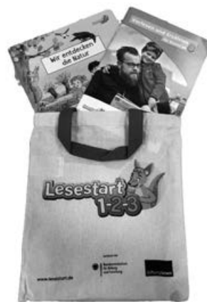
So sieht das Lesestart-Set aus, dass Sie für Ihr dreijähriges Kind in der Bücherei holen können.

„Lesestart 1 – 2 – 3“ ist ein bundesweites Programm zur Sprach- und Leseförderung für Familien mit Kleinkindern. Es wird vom Bundesministerium für Bildung, Familie, Senioren, Frauen und Jugend (BMBFSFJ) gefördert und von der Stiftung Lesen durchgeführt.