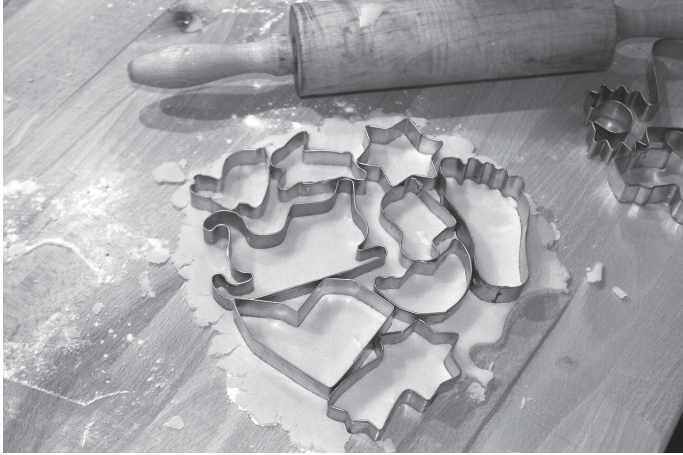
Leckere Ausstecherle werden in der Bücherei Aichwald gebacken

Kurz vor dem ersten Advent wird es in der Bücherei Aichwald nach weihnachtlichem Gebäck duften: am Freitag, den 28. November 2025 um 16.30 Uhr backen Ulrike Oldekop-Körner und Renate Dittrich mit Kindern von 6 bis 9 Jahren im Untergeschoss der Bücherei Aichwald „Ausstecherle“. Wer dabei sein will sollte sich unter Tel. 07 11 / 3 05 19 33 oder buecherei@aichwald.de anmelden, es gibt nur eine begrenzte Anzahl an Plätzen.