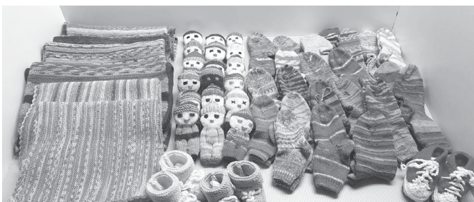
Foto (lb): Übergabe unserer Spende an die Frühchen-Abteilung KH Esslingen

Dienstag, 09.12.25 Weihnachtsfeier (Schurwaldhalle)