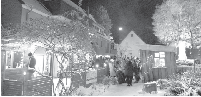
Lichterglanz im Schnee – des wär schee!

es malerisch aussieht) und alles ist traumhaft schön beleuchtet. Man trifft sich zum Bauch wärmen an den Feuertöpfen, zum Glühwein und Feuerzangenbowle oder Winterbier trinken, Rote, Leberkäse oder Raclettebrötchen essen, schwätzen und lachen. Am Samstag freuen wir uns wieder auf die „Jellytones“, die im Lädle zwischen Klopapier und Kartoffeln tolle Musik für uns machen. Party drinnen und draußen! Und wenn's nicht schneit, sondern so trüb und nass wird wie letztes Jahr? Egal, dann ersetzen wir den Schlitten und die Ski durch einen Regenschirm! Gefeierte wird bei jedem Wetter! Und schee wird's auf jeden Fall! Und keiner muss frieren, denn wir heizen draußen ordentlich ein. Lichterglanz und X-Mas-Jam – das Festle vor Weihnachten. Wir freuen uns auf euch! G.M.