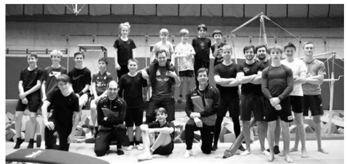
ASV Turner mit Trainer und Gästeturner

Als Jahresabschluss haben wir mit den Jungs vom Geräteturnen ein „Sondertraining“ in der Bewegungslandschaft vom SGCube in Weinstadt durchgeführt. 2 Stunden lang konnten sich die Turner beim Klettern, Springen, Bouldern aber auch beim Turnen an den Geräten austoben. Das ist wirklich eine tolle Truppe – Es hat uns allen richtig Spaß gemacht und wird sicherlich bald wiederholt.