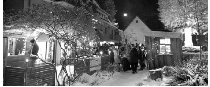
Das Lädle im Lichterglanz und Wintertraum

Alle Jahre wieder....- dieses Festle nehmen wir in's Programm auf. Wir wünschen allen unseren Mitgliedern und Freunden ein schönes Weihnachtsfest und ein gesundes und glückliches neues Jahr. G.M.