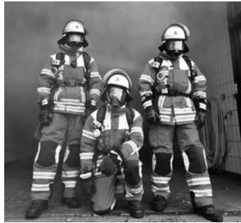
Jetzt komplett in rot. Die neue Einsatzkleidung der FW Aichwald

Diese Jahr war es soweit, die Feuerwehr Aichwald bekommt nach 15 Jahren ein neues Gewand. Die alten Jacken und Hosen sind mittlerweile „in die Jahre gekommen“ und somit musste ein adäquater Ersatz her. Unsere Atemschutzgeräteträger konnten vor kurzem ihre neue Einsatzkleidung in Empfang nehmen. Die Wahl fiel dabei auf den FIRELINER® IV der Firma Consultiv. Sie ist im Vergleich