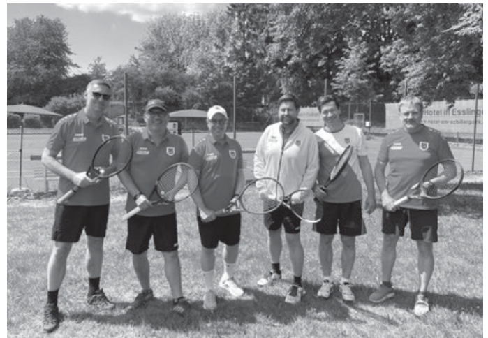
Das Auftaktteam Herren 40 vom TV Aichwald

und 2:6 verloren geben. Die beiden anderen kommen etwas schwerer ins Spiel, lassen den ersten Satz leider mit 1:6 auf die Fildern fahren, kämpfen im zweiten Satz umso härter, können diesen fast noch gewinnen, aber auch hier macht Bonlanden die entscheidenden Punkte und nimmt dieses Doppel mit 6:7 im zweiten Satz mehr als knapp mit. Endstand: 2:4! Aber hey, keiner verletzt, top Wetter auf einer traumhaften Anlage und das war ja das erste Spiel. Für viele der Herren sogar das erste Verbandsspiel überhaupt! Also, weiter geht's, Abschlüsseln, am Montag ins Training gehen und bereit machen für die nächste Begegnung am 20.06.2026, da dann auswärts. Übrigens: Wie auf dem Bild zu sehen treten alle in der neuen Vereinskleidung an. Erhältlich in unseren Online-Shop...auch für Fans des TVA!