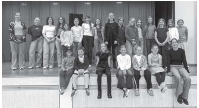
Piano & More