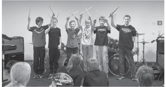
Drums in Focus!