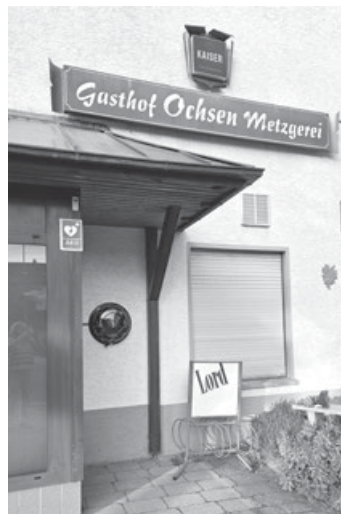
Neu installierter Defibrillator beim Gasthaus/Metzgerei Ochsen