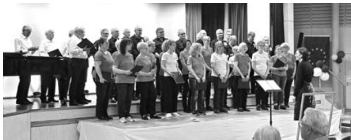
Der gesamte Chor auf der Bühne