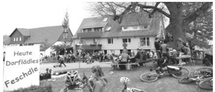
Dorflädles-Maibaumfestle unter der Linde

Mit den Nachbarn das Neueste besprechen oder sich mal ganz mutig zu „Wildfremden“ setzen, und immer wieder zwischendurch den schönen Maibaum bewundern – so kann man den Tag genießen! Herzlich willkommen zum Maibaumfestle in Krummhardt! G.M.