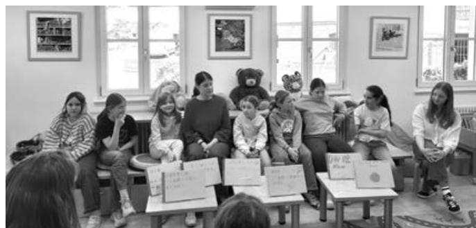
Sieben Mädchen stellten stolz ihre Bücher vor