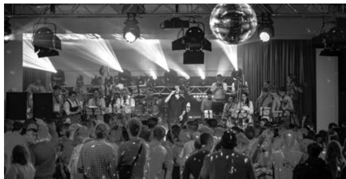
Nach Kinderdisco und Fassanstich legt der Musikverein Aichelberg so richtig los!

Direkt im Anschluss geht's richtig rund: Unsere legendäre „Blasmusik 2.0“ zündet den Turbo und verwandelt das Zirkuszelt in eine einzige Partymanege. Freut euch auf druckvolle Beats, modernen Brass-Sound und eine Stimmung, die garantiert niemanden stillstehen lässt. Ein Abend voller Energie, guter Laune und perfekter Auftakt für ein unvergessliches Jubiläumswochenende!