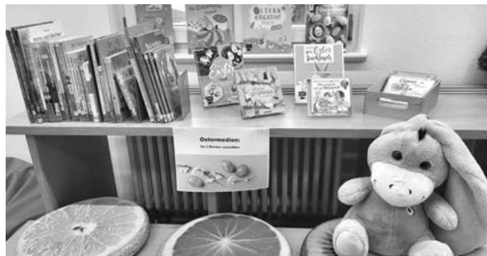
Osterbücher zum Ausleihen in der Bücherei

der Bücherei vorbei. Auf der Sitztreppe im EG finden Sie eine kleine Auswahl an Osterbüchern zum Ausleihen für je 2 Wochen.