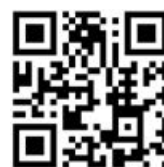
QR-Code Ev. Landeskirche Württemberg