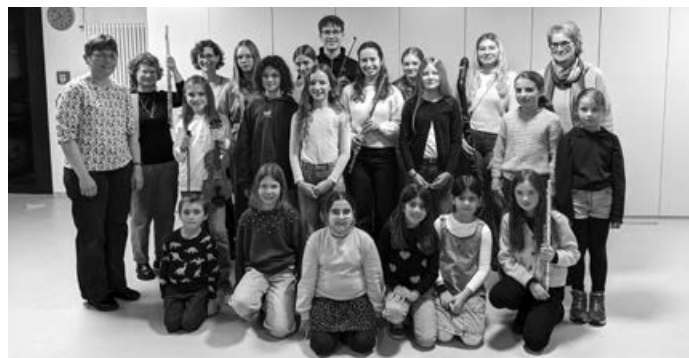
Alle Teilnehmenden der Musikwerkstatt und ihre Lehrerinnen

Der Musiksaal war wieder bis zum letzten Platz besucht und sogar die Kleinsten im Publikum lauschten aufmerksam und freuten sich über die vielen Beiträge mit Querflöte, Geige, Bratsche, Klavier und Blockflöte.