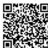
QR-Code Nachrichten aus dem KGR

IBAN: DE89 6115 0020 0000 6824 80, BIC: ESSLDE66XXX