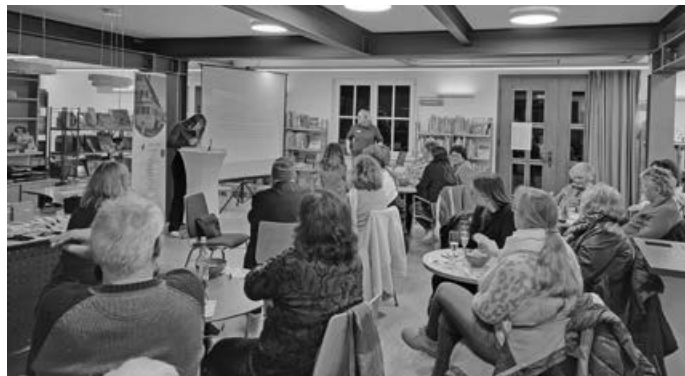
Vollbesetzte Tische beim Pub-Quiz in der Bücherei

CO-Welterbestätten aufzählen – was gar nicht so einfach war, wie auch das restliche Publikum feststellen musste. Schließlich setzte sich nach einer weiteren Stechfrage das Team mit dem nicht zutreffenden Namen „Weiß nichts“ vor den „Linken Socken“ durch.