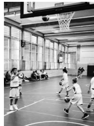
Jungs der U14 bei ihrem ersten Spiel!

Seit einiger Zeit bietet die Abteilung Basketball wieder Trainings für Kinder und Jugendliche an. Zwar ist die Altersstruktur noch breit gefächert, aber für eine Runde in der U14 und der U12 reicht es gerade. Nun bestritt die U14 ihr allererstes Spiel in der Kreisliga B. Für Kinder und Eltern war es ein neues Ereignis in Aichwald und so war die Halle gut besucht. Der MTV Stuttgart w. trat gegen unsere ASV Kangos mit einer erfahrenen Mädchenmannschaft an. Unsere Jungs wirkten anfangs noch etwas eingeschüchtert als sie die deutlich größeren Mädchen des MTV erblickten. Doch während des Spiels überzeugten sie mit großem Ehrgeiz und Kampfgeist und ließen sich trotz ihrer bisher noch geringen Basketballerfahrung nicht unterkriegen. 14 Punkte konnten sie ergattern. Mehr wären noch drin gewesen, wenn ein paar mehr Freiwürfe in den Korb gegangen wären und die Gegnerinnen nicht ganz so viele Bälle erkämpft hätten. An den Mädchen