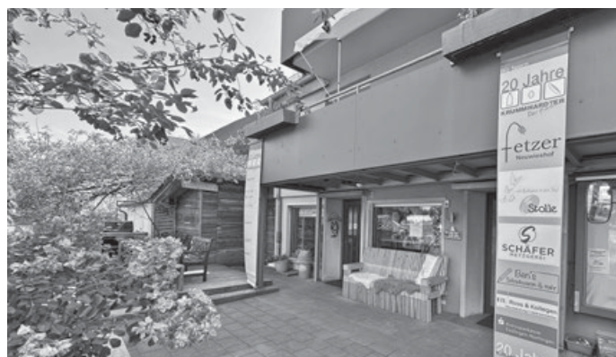
Herzlichen Dank an alle, die uns unterstützen!