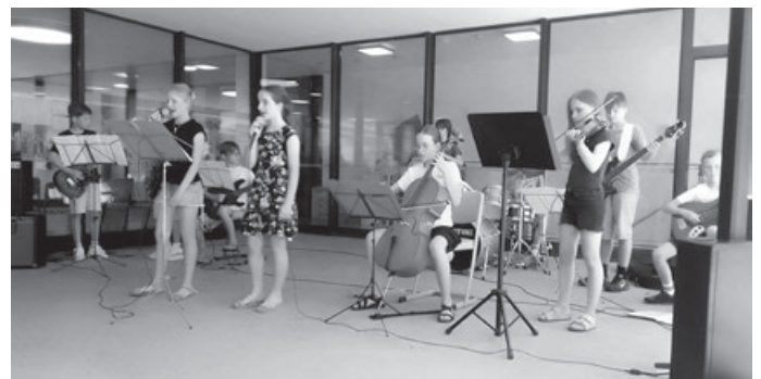
Die Mini-Band der Jugendmusikschule bei ihrem ersten Auftritt

Gerne berichten wir aber auch über einen ganz besonderen Vormittag, zu dem sämtliche Aichwalder Grundschul Kinder jedes Jahr eingeladen werden: Das Kinderkonzert, das unsere Lehrkräfte für den Infotag vorbereiten, dürfen zwei Tage vorher auch alle Schulklassen in der Schurwaldhalle live und hautnah erleben. Das Circus-Orchester eröffnete mit einem Tusch die Vorstellung des Circus Birkus und die Kinder lauschten gespannt wie es klingt, wenn ein Clown nicht mehr ganz trittfest durch die Manege stolpert, der Riese seinen Floh sucht, die Pferde galoppieren oder die Schlangenbeschwörerin und der Messerwerfer ihre Kunststücke zeigen. Am Ende stellten die Musikerinnen und Musiker ihre Instrumente einzeln vor und die Kinder spendeten begeistertem Applaus!