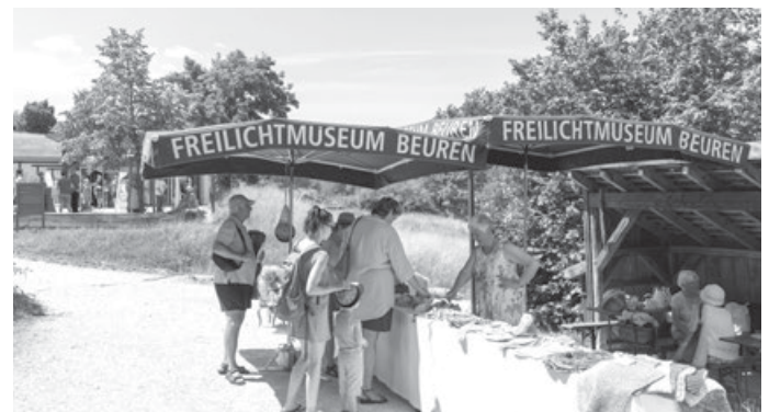
Fairtrade-Akteure und direktvermarktende Betriebe aus dem gesamten Landkreis präsentieren regionale und fair gehandelte Produkte, Foto: Fotoatelier Ebinger

Freilichtmuseum Beuren, Museum des Landkreises Esslingen für ländliche Kultur, In den Herbstwiesen, 72660 Beuren, www.freilichtmuseum-beuren.de , Telefon 0711 3902 41890, info@freilichtmuseum-beuren.de . Öffnungszeiten: bis 1. November, Dienstag bis Sonntag 9.00 – 18.00 Uhr sowie an Feiertagen