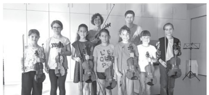
Mit Violinen und Klavier bei der Musikwerkstatt

Die Jugendmusikschule legt großen Wert darauf, den Schülerinnen und Schülern viele Auftrittsmöglichkeiten zu bieten. Die Musikwerkstatt findet 5-6 Mal im Laufe eines ganzen Schuljahres im Musiksaal der Grundschule statt und ist, zusätzlich zu den Klassenvorspielen, dem Winterkonzert und der Soirée, eine gute Gelegenheit, die Vorspielsituation zu trainieren, sei es in Vorbereitung auf Vorspiele in der Schule, Abiturprüfungen oder Wettbewerbe oder, wie es meistens der Fall ist, um die geübten Stücke auszuprobieren und den Eltern und Angehörigen eine Freude zu machen – und natürlich auch, weil Musizieren noch mehr Spaß macht, wenn man damit anderen eine Freude bereiten kann! Davon konnten sich alle Zuhörerinnen und Zuhörer am Montag, 15. Juni, bei der vorletzten Musikwerkstatt vor den Sommerferien überzeugen!