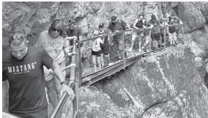
Beim Jubiläums-Ausflug des Musikvereins erlebten die Ausflügler schöne und abenteuerreiche gemeinsame Stunden im Allgäu.

Vielen Dank an Mario für das perfekt ins Detail geplante und organisierte Jubiläumsausflugs-Wochenende!