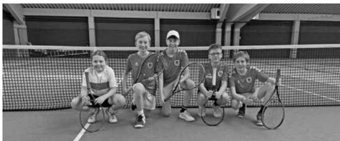
Erneut aufgestiegen...SUPER gemacht Kinder!