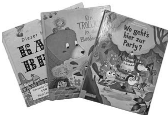
Neue Bilderbücher in der Bücherei

Am Ende der Osterferien steht der nächste Vorlesetreff-Termin an: Mechthild Laddey liest am Samstag, 11. April um 11.00 Uhr Kindern ab 4 Jahren im OG der Bücherei aus neuen Bilderbüchern vor. Auch dafür gibt es einen Stempel in der Vorlese-Pass und für 5 Stempel eine kleine Überraschung!