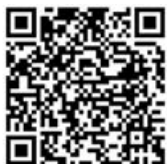
QR-Code Meldeplattform Asiatische Hornisse

Sichtungen von Einzeltieren und insbesondere Nester sollen weiterhin ausschließlich über die Meldeplattform der Landesanstalt für Umwelt gemeldet werden. Dies kann über die Homepage der Landesanstalt für Umwelt (LUBW) oder über die kostenlose „Meine Umwelt-App“ erfolgen: