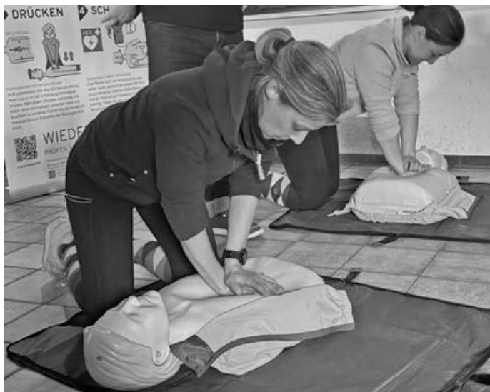
AED-Schulung im Reitverein Aichwald e.V.

Im Reitverein Aichwald e.V. gibt es ab sofort einen öffentlich zugänglichen AED (Automatisierter Externer Defibrillator). Das Gerät befindet sich im Innenhof unserer Anlage und ist bewusst so angebracht, dass es jederzeit für jedermann erreichbar ist – nicht nur für Vereinsmitglieder. Auch Spaziergänger, die beispielsweise auf dem Teerweg in Richtung Lobenrot unterwegs sind, können im Bedarfsfall schnell darauf zugreifen. Gerade dieser freie Zugang war uns ein großes Anliegen, um einen wichtigen Beitrag zur Sicherheit in unserer Umgebung zu leisten.