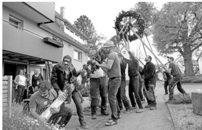
„Henda bissle höher“ – Maibaum aufstellen