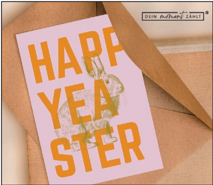
Karten // Hangtags // Osterkörbchen // Geschenktüten // Aufkleber