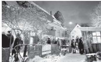
Festliche Beleuchtung vor dem Lädle – Lichterglanz!

Kaum ist ein Festle vorbei, folgt gleich das nächste. Nach unserem tollen Nikolausbesuch freuen wir uns nun auf Lichterglanz am Freitag und Samstag, 15. und 16. Dezember 2023 . Lichterglanz, das Festle vor Weihnachten für alle. Einfach eine Pause machen von den Weihnachtsvorbereitungen, die Lichter genießen, einen Glühwein oder eine Feuerzangen-Bowle trinken, ein Winterbier oder was einem sonst so schmeckt. Als Absacker empfiehlt sich ein feiner Eierlikör, handgemacht von Judith. Dazu eine Rote oder einen würzigen Schweinehals im Weckle, ein knuspriges Raclettebrötle und zum Nachtsch ein paar heiße Apfelküchle. Hört sich doch nach einem soliden Programm an, oder? Der Aufbau hat begonnen, die Feuertonnen stehen bereit, damit's wieder kuschelig warm wird. Am besten beide Tage vormerken, umso schöner wird's! Man trifft sich am Freitag und Samstag ab 17.00 Uhr vor dem Lädle. Wir freuen uns auf euch! G.M.