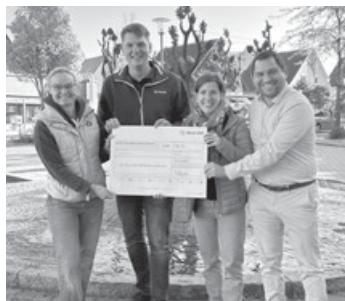
Scheckübergabe der Netze BW an unseren Vorstand mit BM Jarolim.

Grund zur Freude hatten in diesen Tagen die Kinder und Erzieherinnen vom Aichhörnchen-Waldkindergarten e.V.: Die Aktion „Mail statt Brief“ der Netze BW brachte den tollen Betrag von 980,72 Euro in die Vereinskasse. Besonders toll ist es, dass wir mit diesem Betrag unsere neue Bollerwagengarage und Kochgeschirr finanzieren können. Die Netze BW verfolgt mit dieser Aktion das Ziel, möglichst viele ihrer Kund*innen per E-Mail, statt per Brief über die anstehende Ablesung ihrer Stromzählerstände informieren zu können. Die eingesparten Kosten werden als Spende an lokale gemeinnützige Organisationen weitergegeben, wie in diesem Fall an uns, den Aichhörnchen-Waldkindergarten e.V.. Wir als Waldkindergarten finden es besonders gut, dass die Kommunikation auf elektronischem Weg Papierverbrauch und CO 2 -Ausstoß reduziert. Auch unser Bürger-