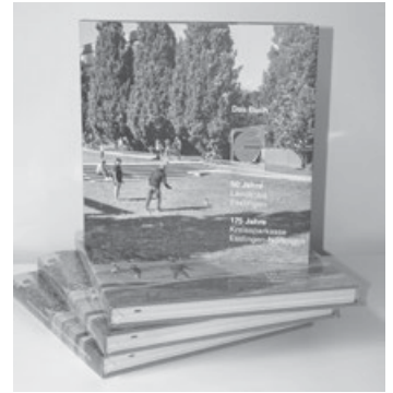
Ein Buch mit vielen Einblicken in den Landkreis extra zum Jubiläumsjahr 2023

„Das Buch – 50 Jahre Landkreis Esslingen 175 Jahre Kreissparkasse Esslingen-Nürtingen“ so lautet Titel des Buches, das der Landkreis und die Kreissparkasse gemeinsam zu ihren diesjährigen Jubiläen herausgegeben haben. Das Buch eignet sich als Geschenkidee unter den Weihnachtsbaum. Im Buchhandel und im Kreisarchiv sind noch Exemplare erhältlich. Die Kreissparkasse und der Landkreis sind in besonderer Weise den Menschen, den Unternehmen, der Natur und der Kultur im Kreis verbunden. In dem hochwertigen Landkreisbuch geht es auf 180 Seiten in 47 reich bebilderten Texten auf Spurensuche. Eine Autorin und vier Autoren, die viele Jahre als Journalisten im Landkreis tätig waren, haben beispielhaft Themen aus Kommunalpolitik, Leben, Umwelt, Gesundheit, Bildung, Arbeit, Tourismus und Kultur aus ungewöhnlichen Perspektiven beleuchtet und mit leichter Feder niedergeschrieben. Erzählungen von Persönlichkeiten runden das Bild ab. Mit den Fotos war das Fotoatelier Ebinger in Nürtingen beauftragt. Das Buch wurde von der Grafikerin Ina Ludwig aus Stuttgart gestaltet und von GO in Kirchheim verlegt. Das Buch „50 Jahre Landkreis Esslingen 175 Jahre Kreissparkasse Esslingen-Nürtingen“ ist im Buchhandel zum Preis von 24,90 Euro erhältlich. ISBN 978-3-933235-27-5. Das Buch kann ebenso über das Kreisarchiv, E-Mail: kreisarchiv@LRA-ES.de , bezogen werden.