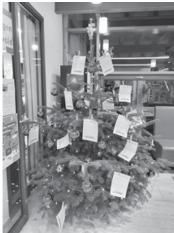
Der diesjährige Bücherwunschbaum

Der Bücherwunschbaum der Gemeinde Aichwald macht jedes Jahr Bücherwünsche von Kindern aus Familien mit der Aichwald-Card wahr. Die diesjährigen Wunschkarten wurden alle innerhalb weniger Tage von Aichwalder Bürgern gepflückt – hierfür herzlichen Dank!