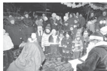
Oh Tannenbaum – alle singen mit und der Nikolaus freut sich

Viele Kinder haben brav gewartet, bis das Spektakel endlich startet. Und endlich kommt vom Walde er her, ne Glocke in der Hand, der Schritt so schwer. Der Bart strahlt hell im Lichterschein, das kann doch nur der Nikolaus sein! Gar finster drein Knecht Ruprecht schaut, ob er uns mit der Rute haut??Nein! Im Nikolaus-Buch steht, drum ist's wohl wahr, ganz arg brav ist die Krummhardter Kinderschar! Sportlich, musikalisch, stets sauber und adrett, und immer zu Bruder und Schwester sehr nett! Drum bleibt die Rute am Boden liegen, weil