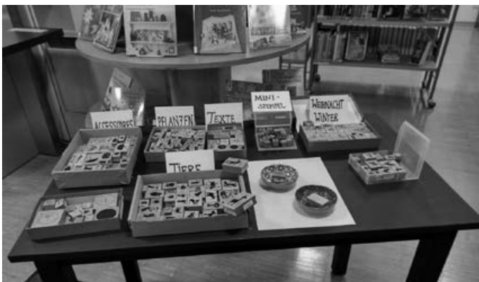
Simone Jungkind hatte eine riesige Auswahl an Stempeln mitgebracht

Am 21. Oktober wurde abends nach der Büchereischließung das Stempeln „geübt“. Dazu hatte Simone Jungkind mit ihrem Sortiment