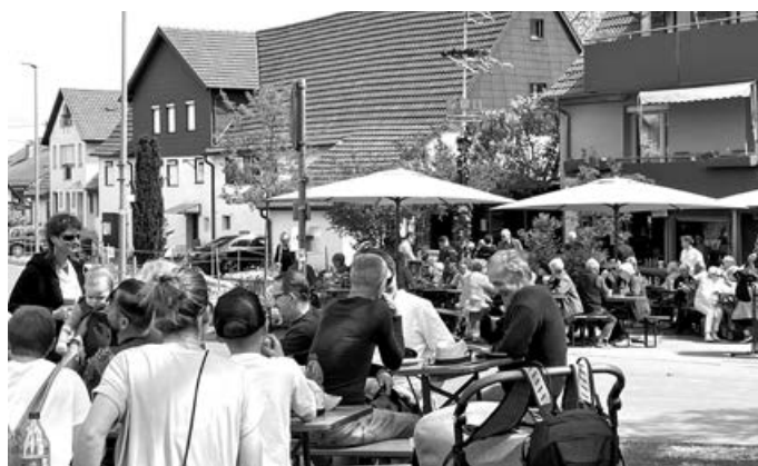
Sonnenschein und viele Gäste beim Maibaumfest in Krummhardt

Wir sind rundum glücklich und zufrieden und dankbar.