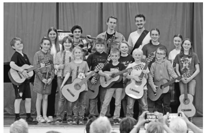
Gitarren, Blockflöten und strahlende Gesichter