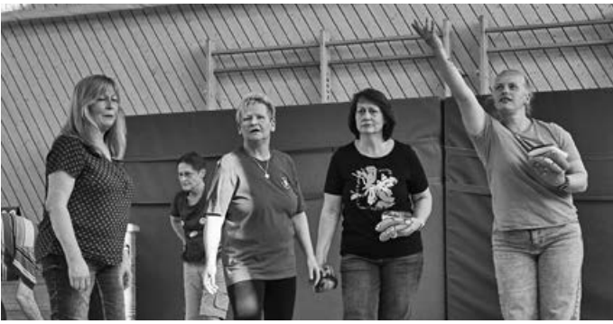
Konzentration beim Wurf