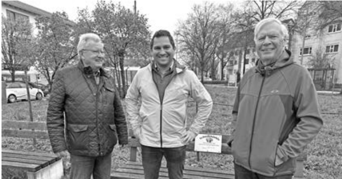
Schwätzbänkle-Plausch am 14.04.2026