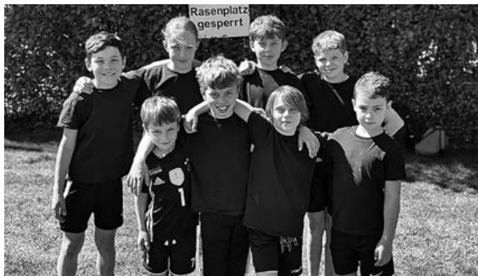
ASV-Turner beim Mehrkampftag in Denkendorf