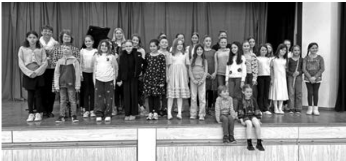
Flauto & Piano