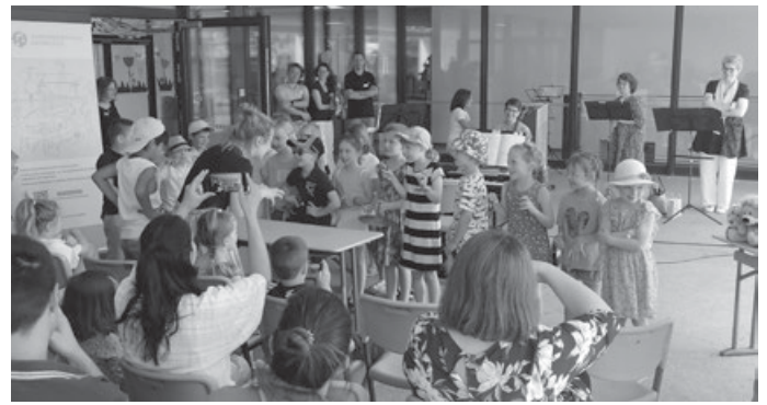
Kinder der Musikalischen Früherziehung musizieren am Info-Tag

Für die Bewirtung sorgte der Trägerverein, für dessen Unterstützung wir uns herzlich bedanken möchten!