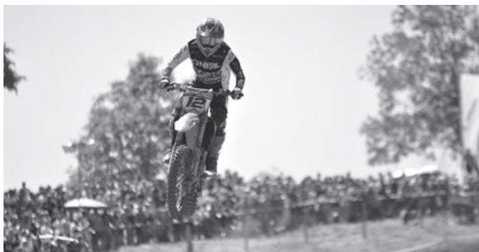
Max Nagl begeisterte alle Motocross-Fans in Aichwald