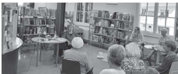
Gemütliche Kaffeehaus-Atmosphäre in der Bücherei Aichwald