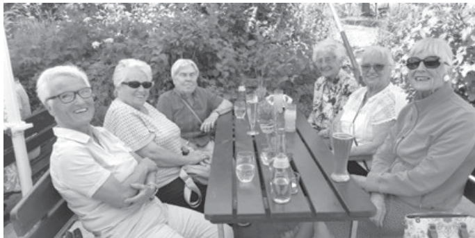
Rückblick Seniorennachmittag – Ausflug