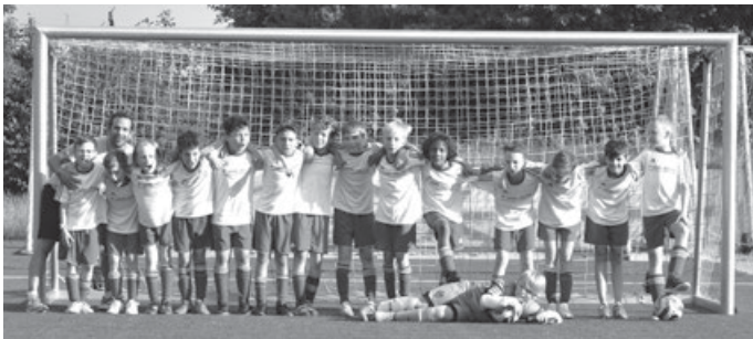
Letztes Heimspiel gegen Deizisau

anderen ASV-Jungs und auch sie lassen kein Tor mehr zu. Schöner Abschluss und ein schöner Vertrauensbeweis vom Trainer, dass ALLE dazu gehören. Das war's, die erste offizielle Saison der E-Jugend ist bereits vorbei. Die Jungs vom ASV mussten oft ganz schön einstecken aber es waren immer wieder alle am Start um das weiße Trikot und die rote Hose anzuziehen! Nächste Saison wird komplett neu gemischt. Ein paar der Jungs rücken auf in die D-Jugend, ein paar kommen nach aus der F-Jugend. Man darf gespannt sein, wie es dann läuft. Wir Fans hoffen natürlich auf den ein oder andern Sieg. Klasse gemacht, trotz teils hoher Niederlagen nicht aufgegeben und als Mannschaft sichtlich zusammengewachsen. Den Trainern an dieser Stelle ein Riesen Dankeschön für eure Zeit für Trainings, Spiele, Turniere und das ein oder andere Extra-Event drumherum.