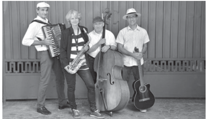
Les For me-dables