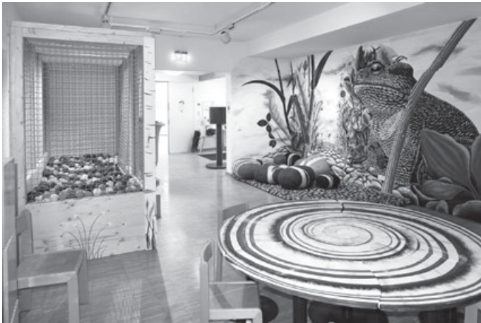
Ein Schneckentisch, ein Bällebad und phantasievolle Wandbilder – so sieht das neu gestaltete Albentdecker-Zimmer im Naturschutzzentrum Schopflocher Alb aus

Die Neugestaltung des Albentdecker-Zimmers kostete insgesamt 29.000 Euro, 80 Prozent davon kommen aus Mitteln der Baden-Württemberg-Stiftung, die dem UNESCO zertifizierten Biosphärengebiet Schwäbische Alb zur Verfügung gestellt wurden. „Wir danken der Stiftung sowie der Geschäftsstelle des Biosphärengebiets Schwäbische Alb für die Förderung, nur durch das Zutun beider konnte das Spielzimmer verwirklicht werden“, sagte der Esslinger Landrat.