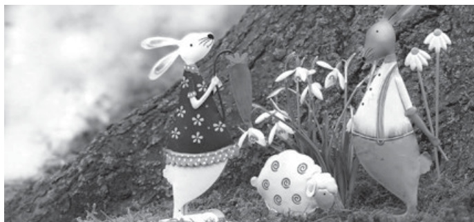
Frühlings- und Osterdeko zum Tauschen in der Bücherei Aichwald

Hat sich bei Ihnen auch so viel Frühlings- und Oster-Deko angesammelt? Und Sie hätten gerne wieder etwas Neues? Dann bringen Sie uns Ihre Sachen vorbei! Diese werden ab 3.03.2023 im OG der Bücherei Aichwald ausgestellt und Sie können sich von dort gerne etwas Neues aussuchen.