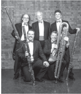
SWR Swing Fagottett

„Von Bach bis Benny Goodman“ Fagottisten im Viererpack sind schon eine Rarität, zumal mit einem höchst vergnüglichen Programm, das dem erstaunten und amüsierten Publikum ungewohnte Hörabenteuer beschert. Das Fagottett begeistert durch mitreißende Spielfreude, höchste Virtuosität und eine enorme Programmvietfalt – von leichter Klassik über Swing bis zum Jazz. Es gibt Originales und Originelles, vieles kennt man durchaus, und mancher Klassiker wird auch mal respektlos „gegen den Strich gebürstet“.