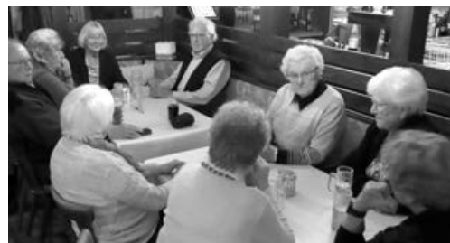
Stammtisch-Runde in 11/2021

Folglich ist der nächste Stammtisch am Do, 28.4.2022 ab 19.00 Uhr. Wir freuen uns über Jede und Jeden, der ein paar gemütliche Stunden mit uns verbringen will und kameradschaftliche Gespräche.