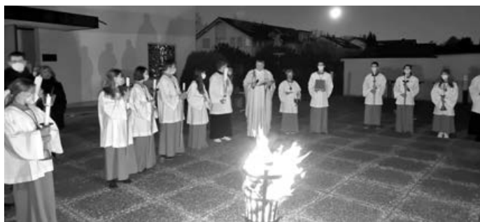
Feier der Osternacht