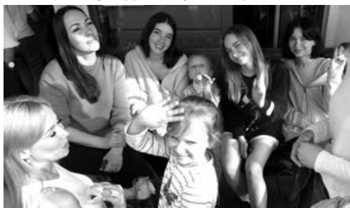
„Unsere Mädle“ aus der Ukraine

Zum Schluss noch für Nicht-Schwaben: Penséle ist kein ukrainisches Wort. Das findet keine Übersetzungs-App, oder? Denn so heißen Stiefmütterle auf schwäbisch-französisch!