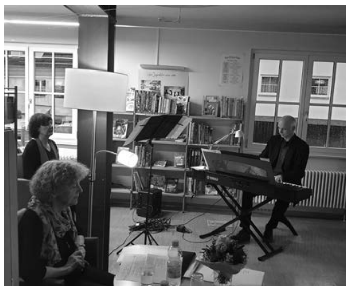
Das Ensemble Divertimento in Aktion